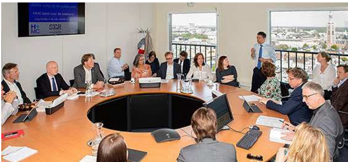
SER bezoekt HMC Westeinde